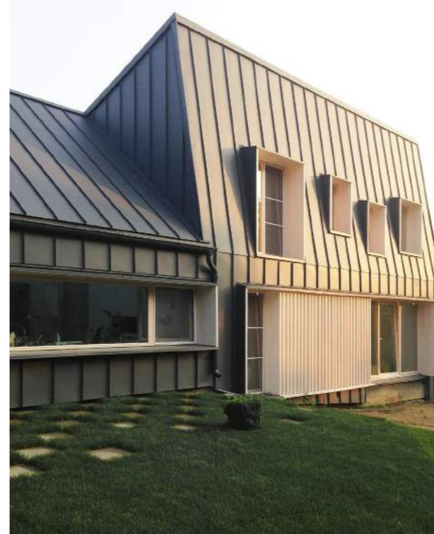
Karelian house частный дом Россия