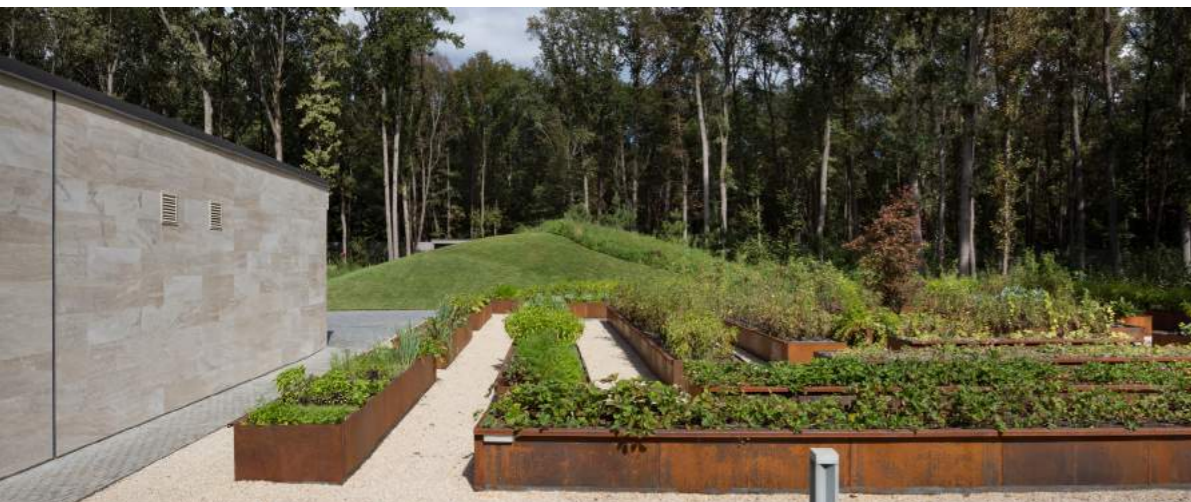
House with a peristyle частный дом ландшафт Харьков

ников, работающих над концептом часто больше тех, кто работает непосредственно над рабочим проектом, поскольку мы стараемся учитывать максимально большое количество различных мнений, критики и так далее. Количество игроков в команде все время «плавает» — мы универсалы и делаем все, от интерьера до мастер-плана, а в последнее время еще и много ландшафтных проектов. Ведь все, что применимо для архитектуры, применимо и для ландшафтов.