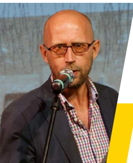
Бесідовал, спеціально для L&amp;A