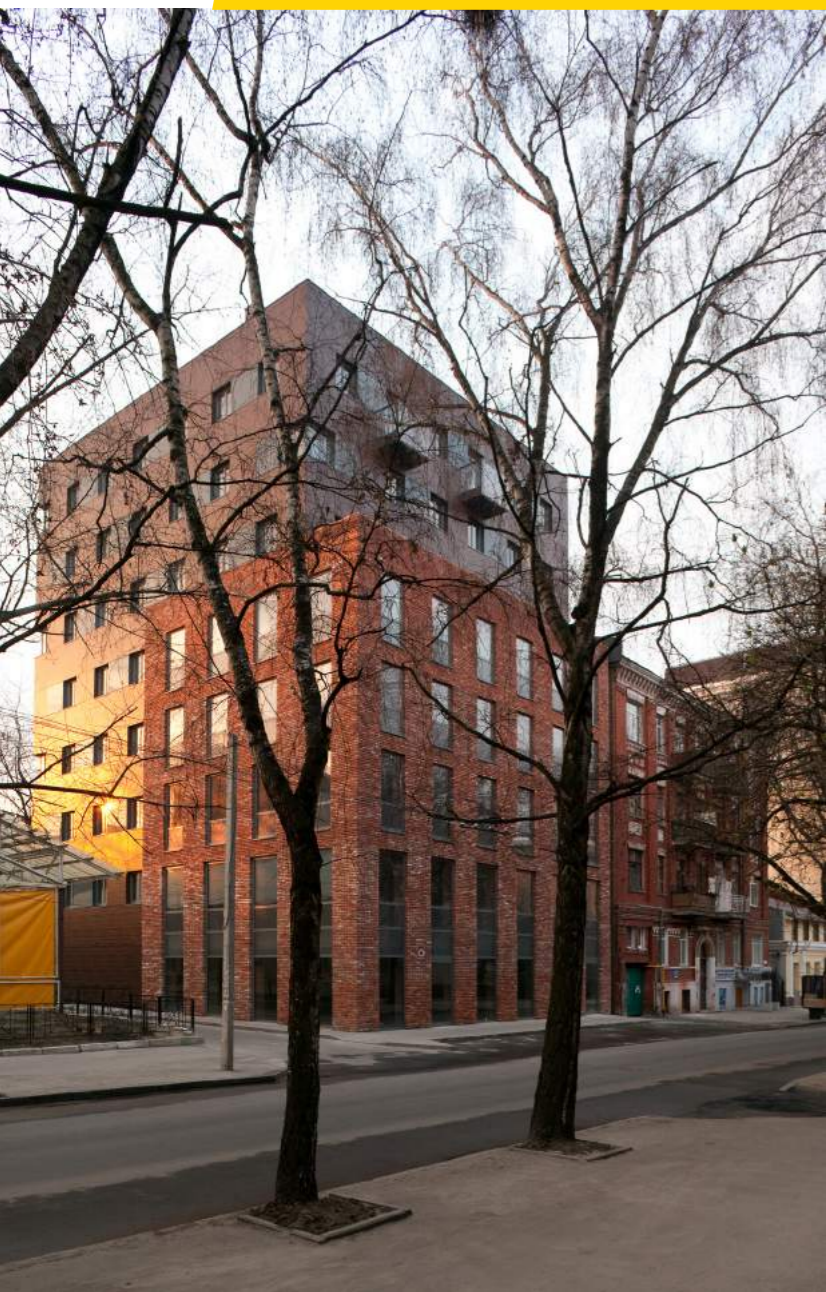
Heigloom жилой дом Харьков

первом, и в этом смысле идея будущего мне близка. По-настоящему глаза отдыхают, а мозг работает, когда ты находишься в вернакулярной, нетрадиционной среде.