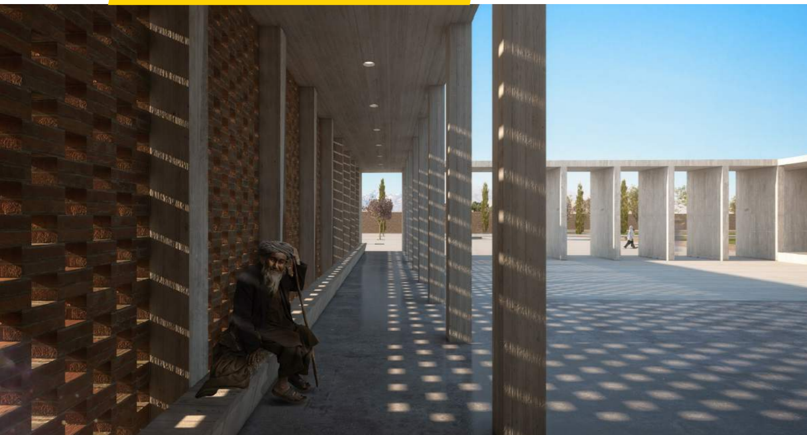
Ватіуал культурний центр Афганістан