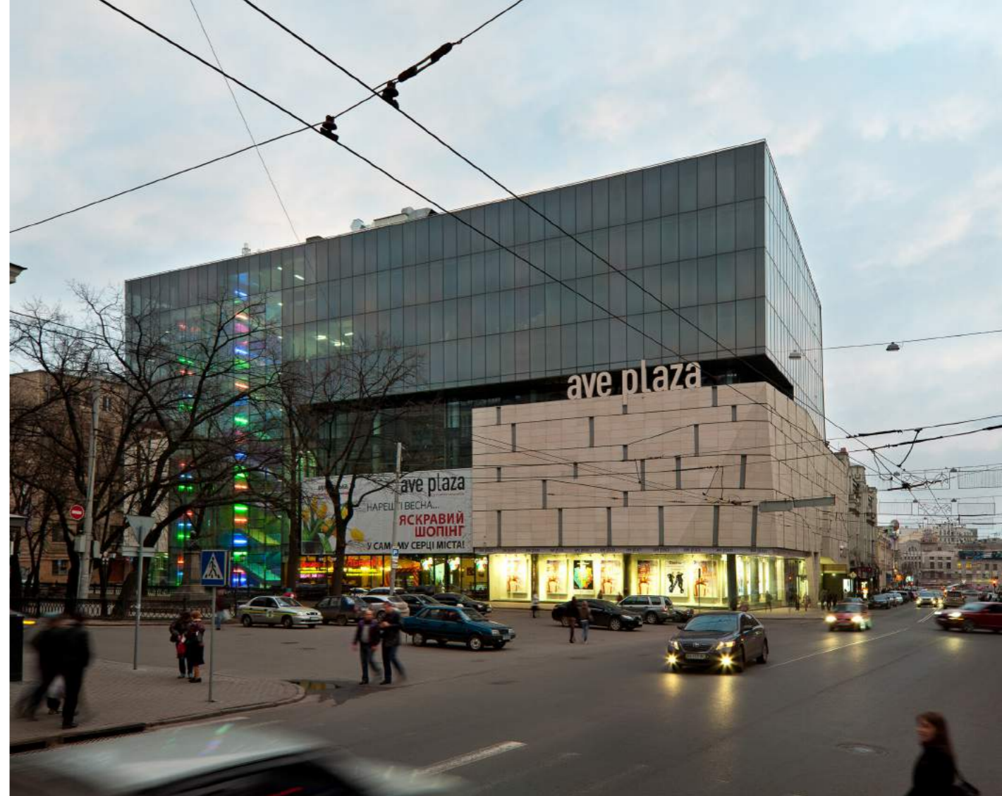
Ave plaza офісно-торговий центр Харків