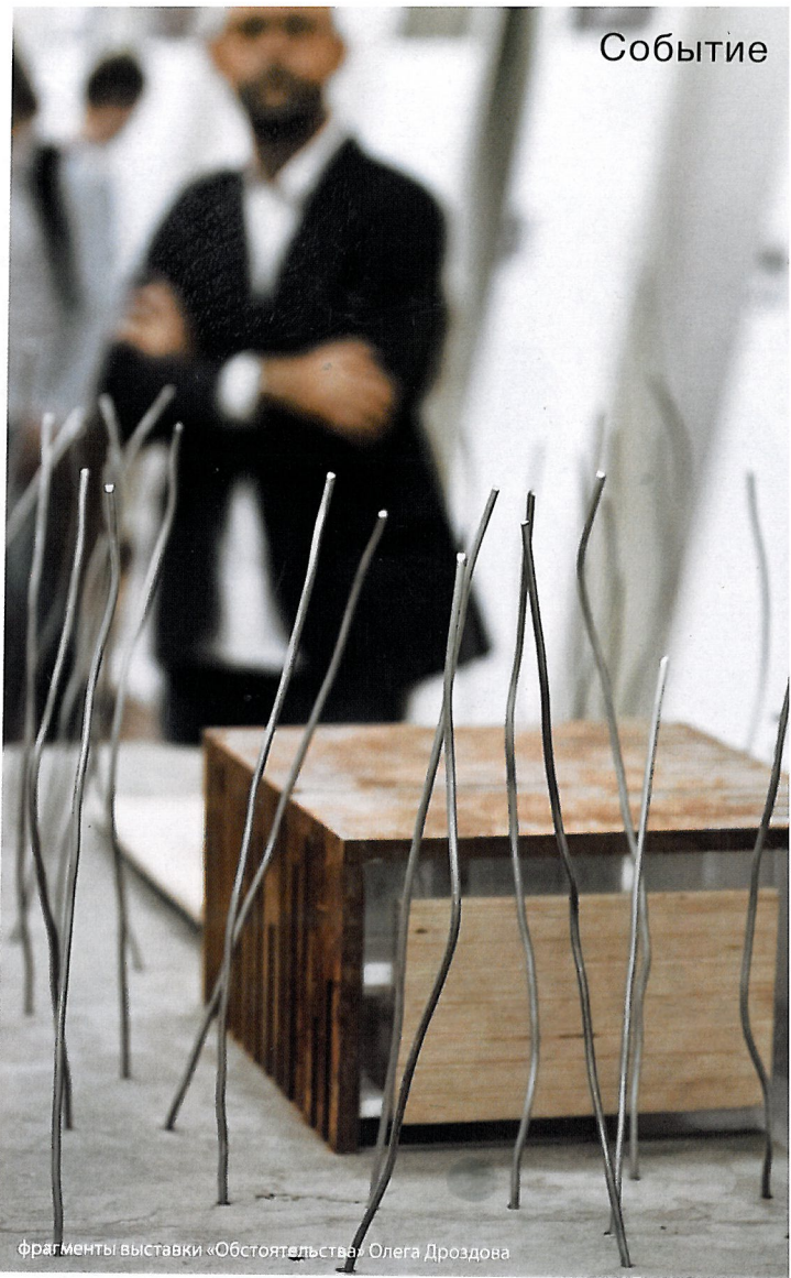
фрагменты выставки «Обстоятельства» Олега Дроздова