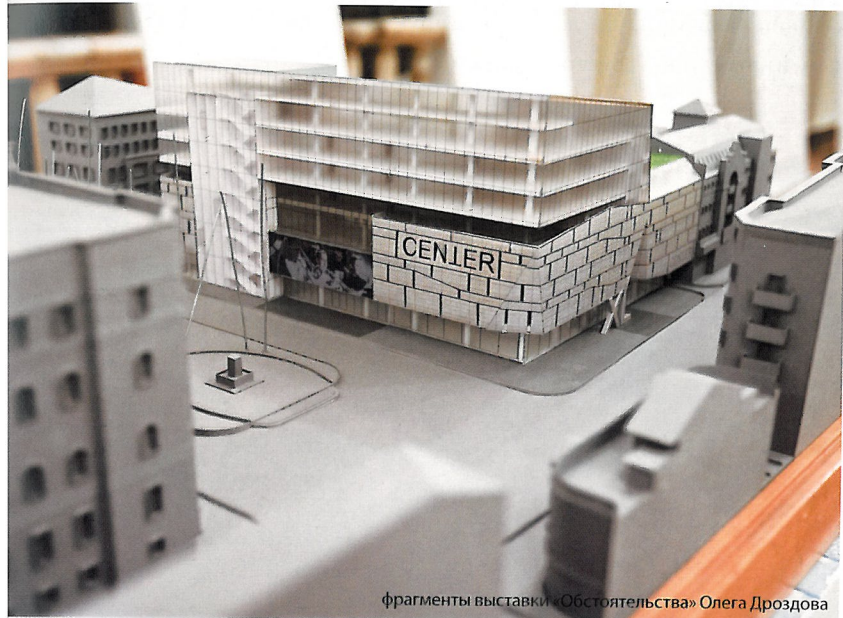
фрагменты выставки «Обстоятельства» Олега Дроздова