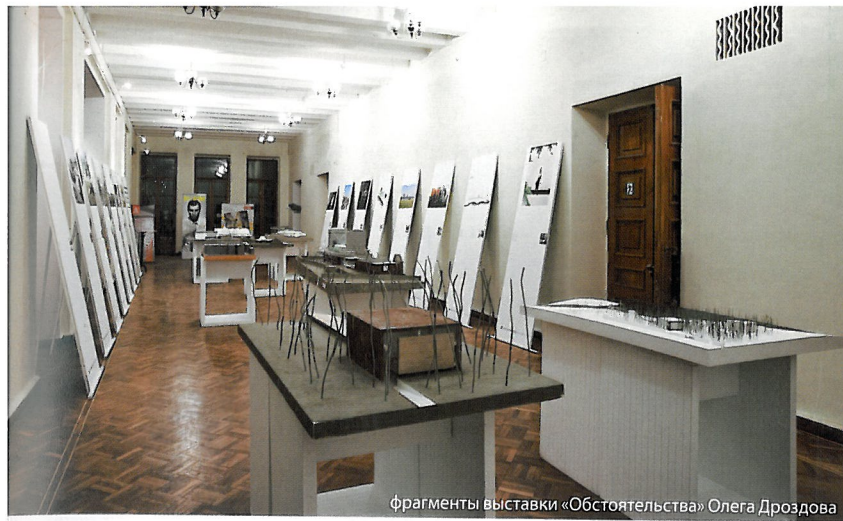
фрагменты выставки «Обстоятельства» Олега Дроздова