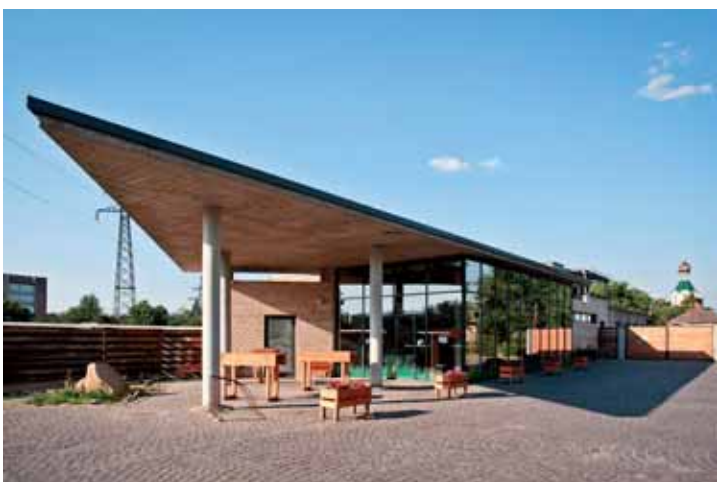
1 Petr Sarvaš / ZYX: pekárna DIK v Užhorodu; foto: archiv autora.